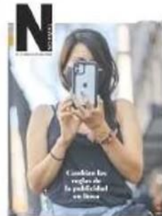
BUSCA EN INTERIORES SUPLEMENTO NORMAL

"Sabemos que en las áreas urbanas de nuestro estado tendrá que ser así porque va a haber muchos pacientes que en el valle". Pág. 5